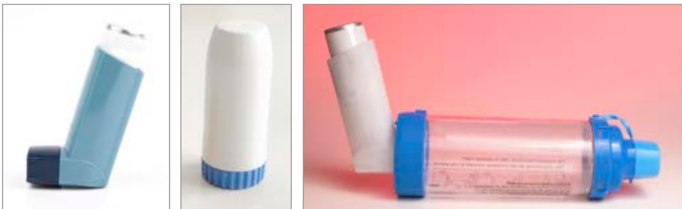
Illustration 1 : Inhalateur avec tube d'espacement/aérochambre