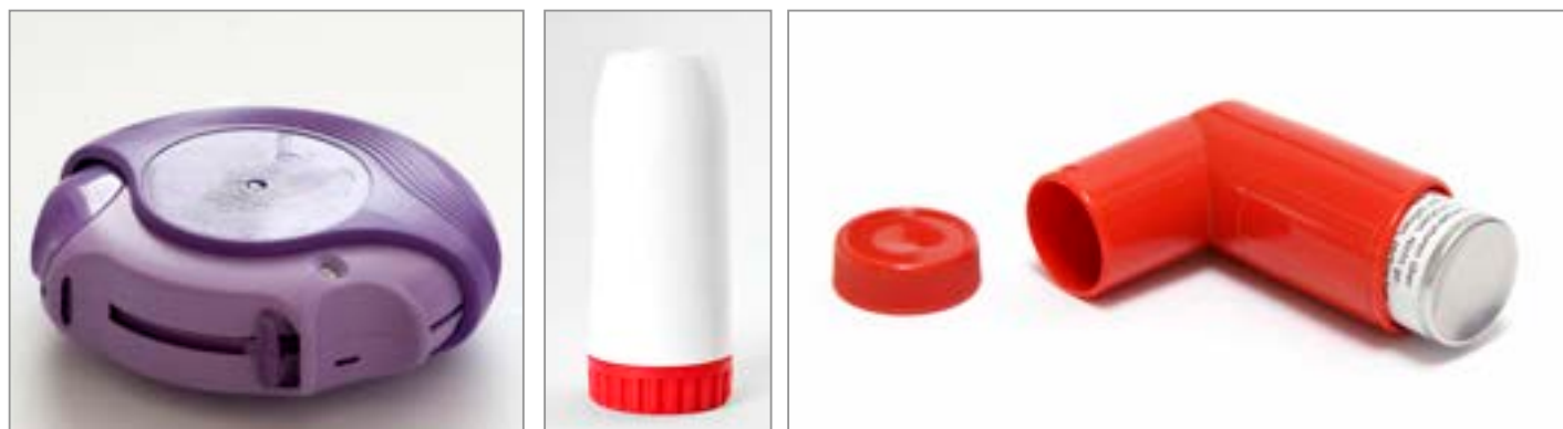
Illustration 2 : Des exemples de médicaments de contrôle

Les enfants de très bas âge, généralement ceux de moins de sept ans, auront besoin qu'un adulte leur administre leur médicament. S'ils ont reçu des consignes appropriées, la plupart des enfants de sept ans et plus sont capables de comprendre à quel moment ils ont besoin de leur médicament et la façon de l'utiliser correctement. Lors de l'utilisation de médicaments contre l'asthme ayant recours à un inhalateur (c'est-à-dire, un inhalateur doseur), il est recommandé d'utiliser un tube d'espacement avec l'inhalateur pour assurer que le médicament se rende bien aux poumons. Il est très important que les enfants aient facilement accès à leur inhalateur bleu de soulagement. Une crise d'asthme mettant en danger leur vie peut se manifester à tout moment.